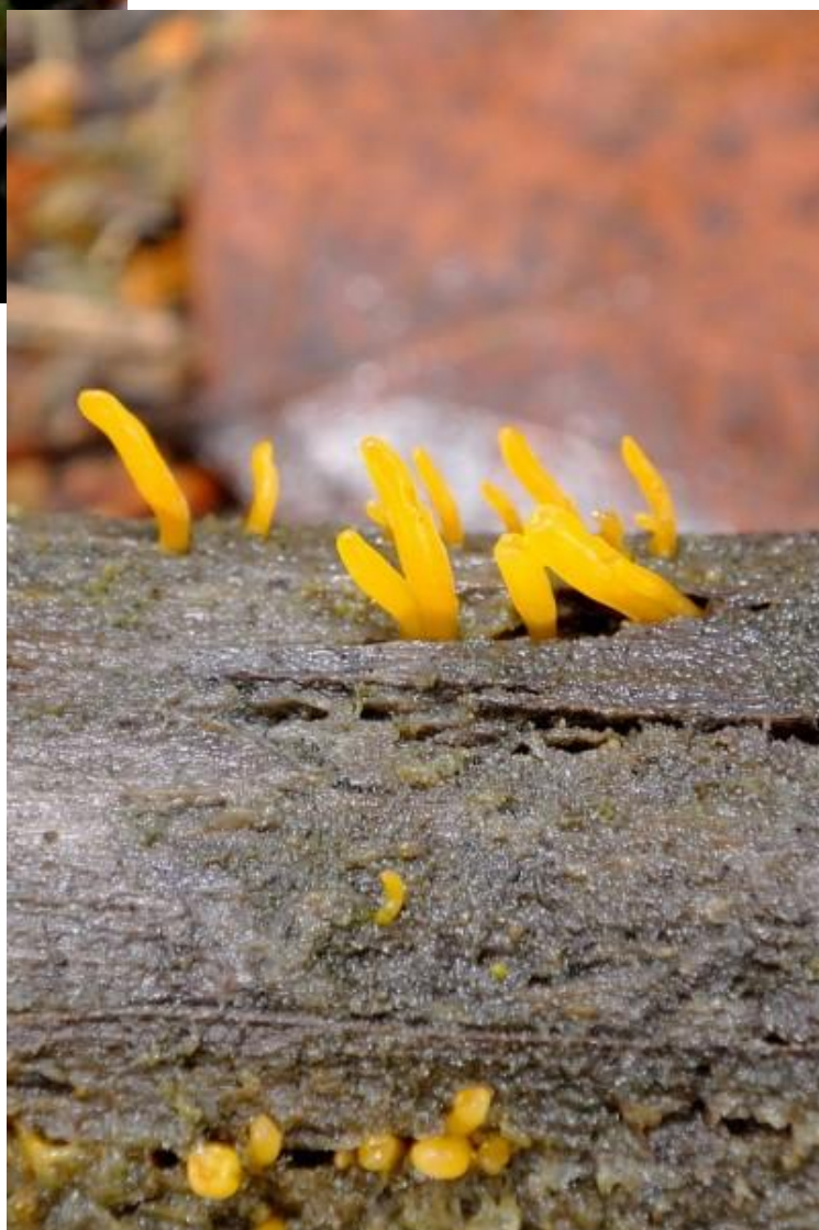
En geel hoorntje