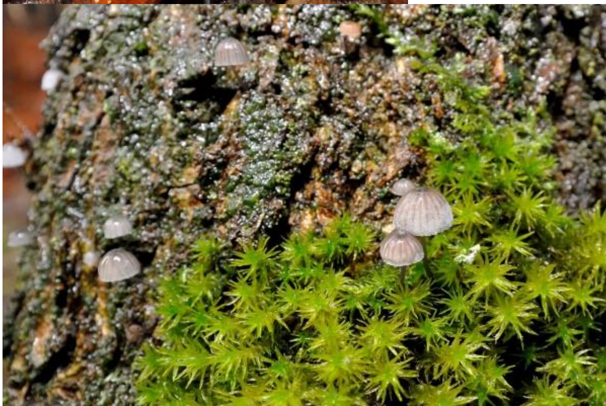
En grijze schorsmycena's